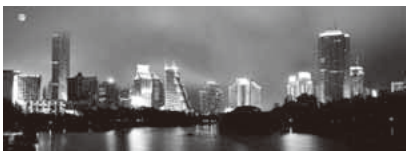
在公司的年銷售額已經突破了2億元。

【第一財經日報報導】「一拍即合」的創業方式，在深圳並不鮮見。這裏大小大小有數十個民間組織的創業沙龍，特別是在南山區的科技園。每到週末，一些有著項目和技術的人就會聚集在一起，商討他們的創業夢想。在這個城市的血液時刻流淌著創業的基因，這裏的人們的創業夢想也從未間斷過。