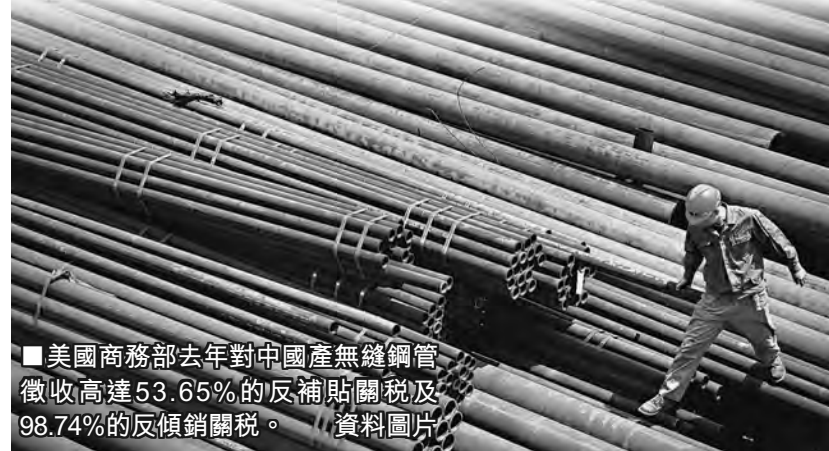
美國商務部去年對中國產無縫鋼管徵收高達53.65%的反補貼關稅及98.74%的反傾銷關稅。資料圖片

中國國家發改委對外經濟研究所研究員張燕生表示，針對違背WTO原則的貿易爭端，要提出針鋒相對的做法，對目前歐美貿易保護主義抬頭的趨勢，中國企業應積極調整和應對，包括用法律等各種手段。除此之外，就是要調整自身產品結構，在技術含量以及出口市場的多元化方面要做更多的努力。