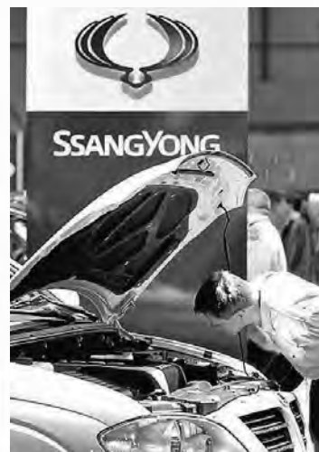
2009年，上汽集團申請併購韓國雙龍失敗。

專家：海外投資促經濟轉型 經濟學家認為，中國單純依靠貿易的格局需要做一些調整，要通過海外投資，成功介入全價值鏈的過程進行管理、經營，以擺脫目前出口的不合理局面，促進國內的經濟轉型。 有觀點認為，當今世界國際投資對於經濟發展的貢獻已經超越了國際貿易，在經濟發展方式的轉型升級中，國際投資應該成為一國經濟發展戰略核心。