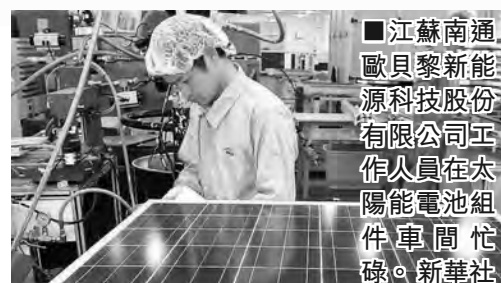
江蘇南通歐貝黎新能源科技股份有限公司工作人員在太陽能電池組件車間忙碌。

此外，在海外的商業存在形式上，中國要着力培養自己的跨國公司。擁有本土經濟形式參與、創造當地就業的跨國公司易於打破貿易壁壘。