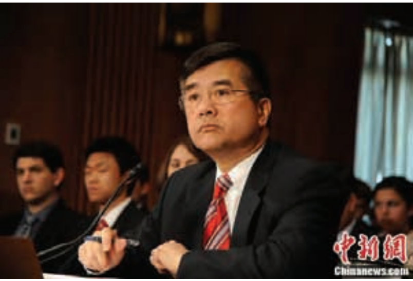
現年61歲的駱家輝出生於華盛頓州西雅圖，是華人移民第三代，祖父祖籍廣東台山，據稱是“初唐四傑”之一駱賓王的後代，上世紀初移民美國。他先後在美國耶魯大學和波士頓大學學習。

參議院外交關係委員會主席克里表示，他充分期待駱家輝的提名能獲通過，並稱奧巴馬的這一提名是“明智的選擇”，自己對這一任命感到“興奮”。