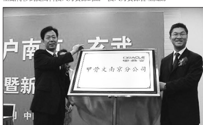
圖為中國科技人力資源總量已達4200萬，但在其總人口中的比重還低，與發達國家相比也有不小的差距。報告建議中國應把發展重點轉移到提高科技人力資源的品質上來，合理配置科技人力資源，提高科技人力資源使用效率，加大高技能人才培養力度，積極引導科技人力資源合理流動。

達4200萬，但在其總人口中的比重還低，與發達國家相比也有不小的差距。報告建議中國應把發展重點轉移到提高科技人力資源的品質上來，合理配置科技人力資源，提高科技人力資源使用效率，加大高技能人才培養力度，積極引導科技人力資源合理流動。