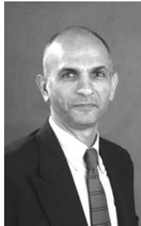
編者按：當代農業和工業的發展已給現代社會帶來了不平衡的發展結果，我們的責任是要給後